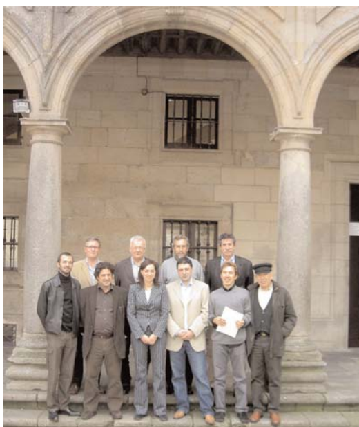
O COMITÉ ORGANIZADOR E MAILA DIRECTIVA DO COAG

Na actualidade o congreso está organizado por Andar Quatro Arquitectura e mailo Colexio Oficial de Arquitectos de Galicia. Ademais conta co apoio do Ministerio de Vivenda, a Xunta de Galicia, o Concello de Santiago e a Universidade da Coruña, entre outras institucións.